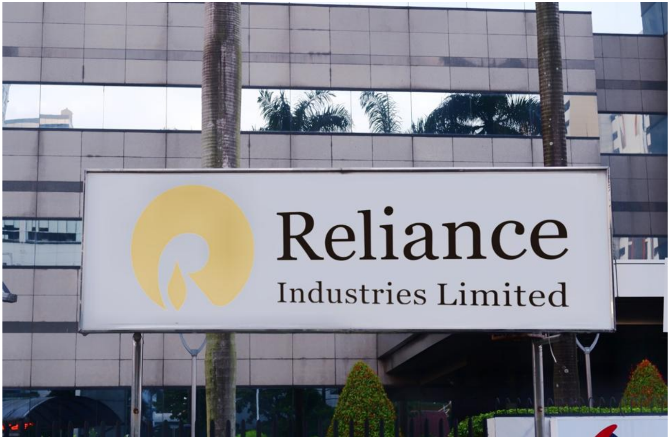
“トランプ政権 印 Reliance にベネズエラ産原油購入の制裁ライセンスを発行”