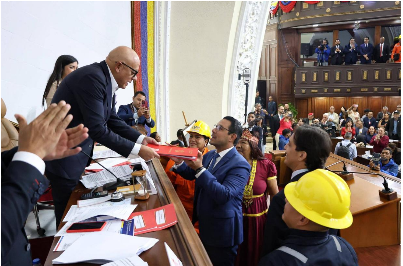
(写真) @delcyrogriguezv “4月9日 ベネズエラ国会 鉱物法の改定を承認”