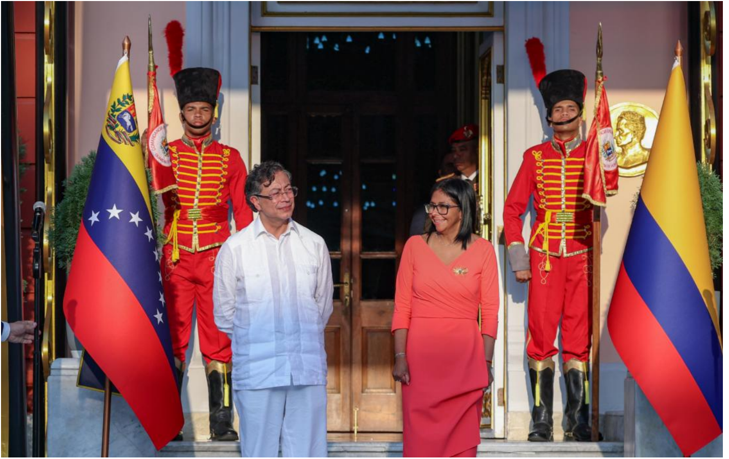
“コロンビアのペトロ大統領 ベネズエラ訪問、暫定大統領と初の首脳会談”