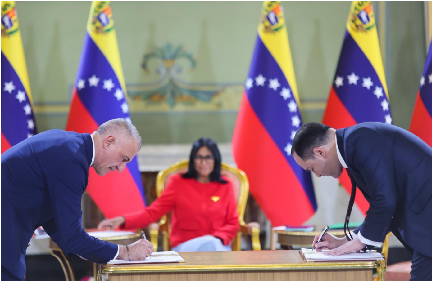
（写真）大統領府 “Eni・PDVSA 天然ガス・軽質油の生産拡大で協定を締結、Junin 5 プロジェクト再始動”