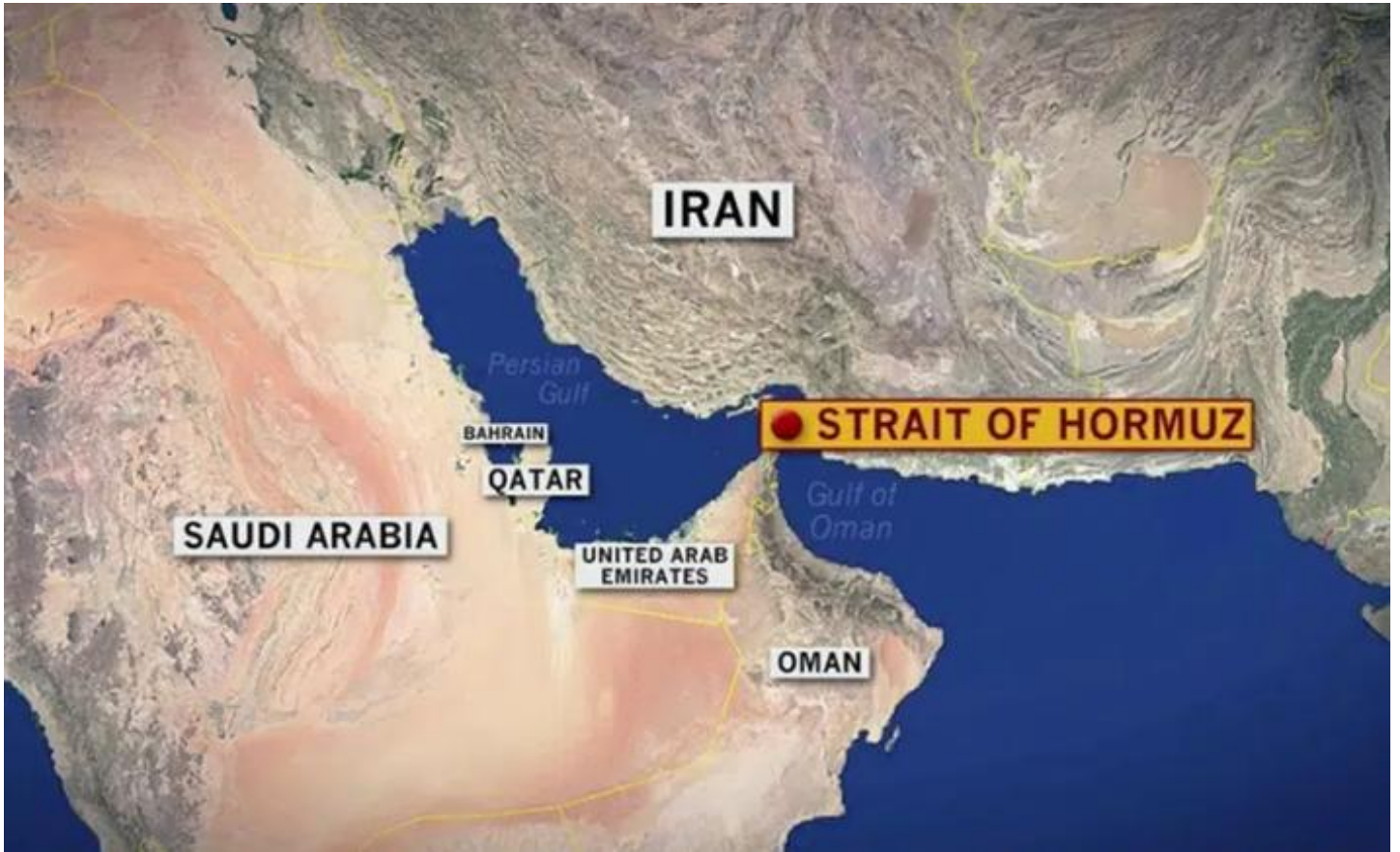
(写真) Sumarium “米国・イスラエル イランを攻撃、報復措置でイラン革命防衛隊がホルムズ海峡を封鎖”