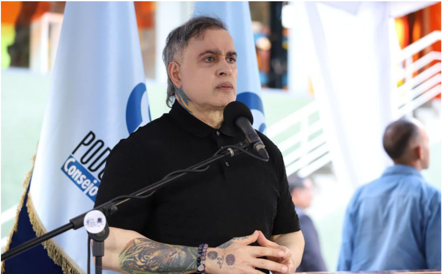
“タレク・ウィリアム・サアブ検事総長が国会に辞任意志表明、人権擁護官に”