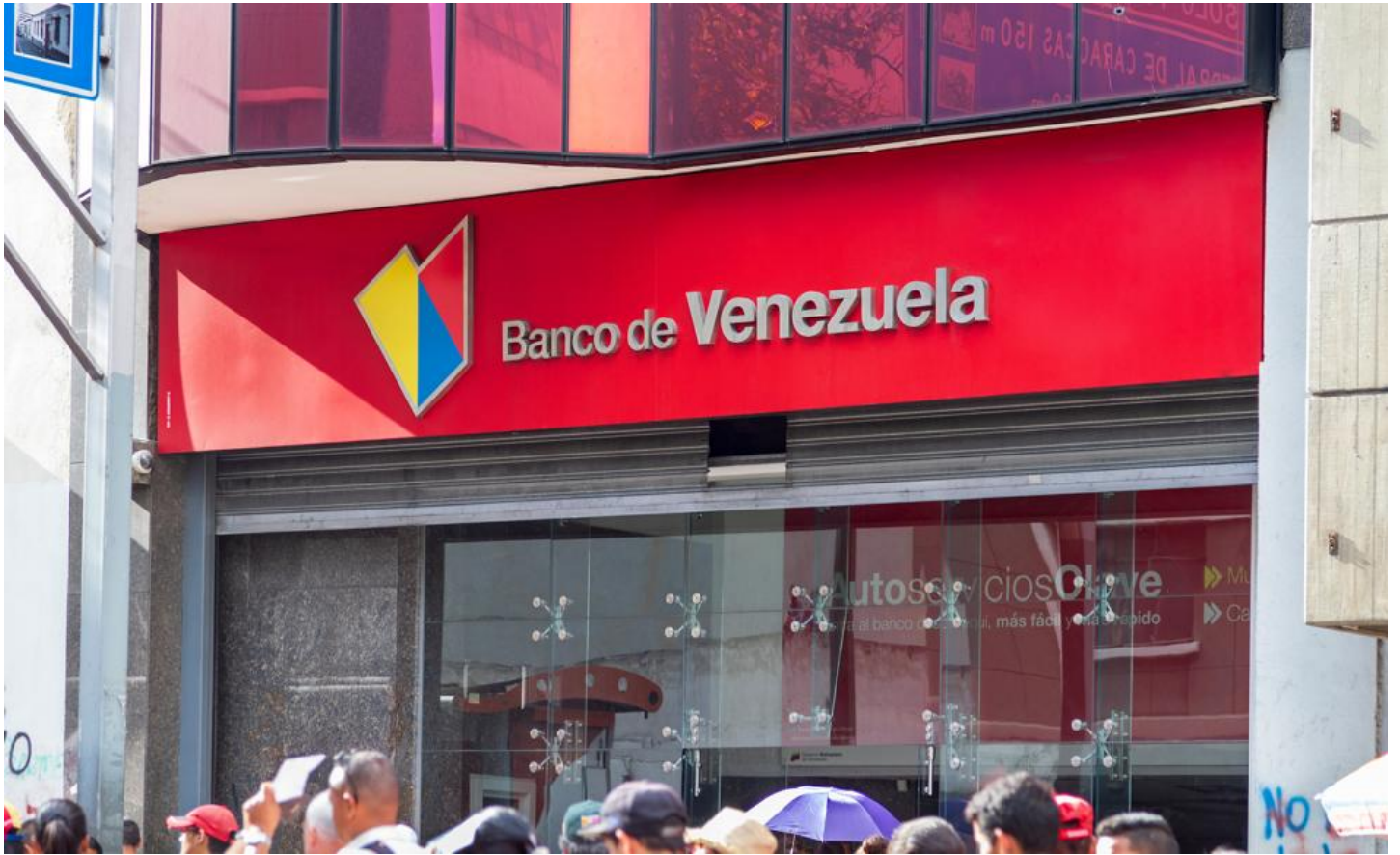
“米 OFAC ベネズエラ中央銀行・国営銀行に対する制裁を緩和”